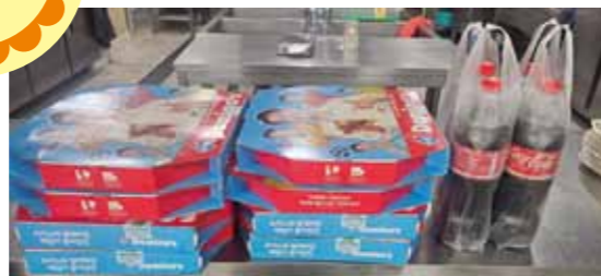
3/15 익명 | 피자 후원

설 명절, 새학기를 맞아 후원물품을 보내주신 후원자님들께도 감사인사 드립니다.