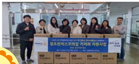
2/27 동남로타리 클럽 | 기저귀 후원