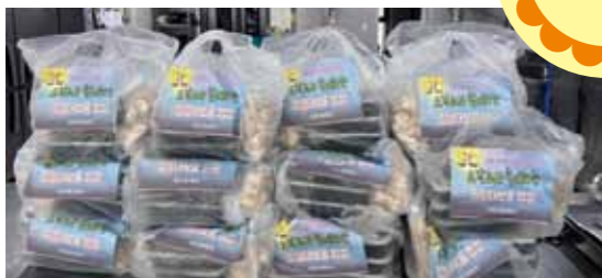
2/28 부산 남구청 | 정월대보름 도시락