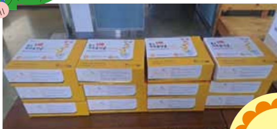
2/11 조오우 | 유산균 후원