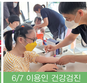
6/7 이용인 건강검진