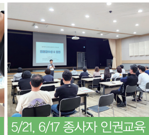
5/21, 6/17 종사자 인권교육