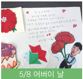
5/8 아버지 날