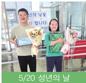
5/20 성년의 날