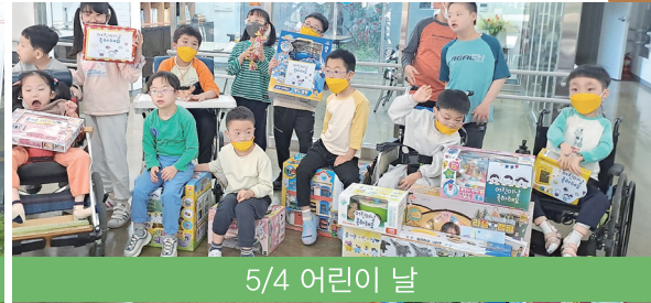
5/4 어린이 날