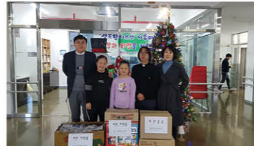
남수영구 약사회 의약품 후원