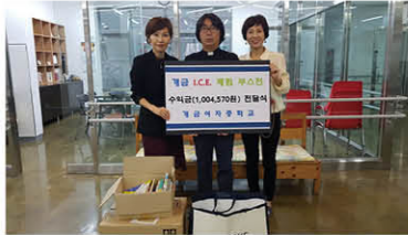
개금여중 바자회 수익금 기부

성탄과 연말을 맞이해 따뜻한 손길이 이어졌습니다. 후원자님들의 소중한 후원으로 풍성하고 행복한 연말 보냈습니다. 감사합니다^^