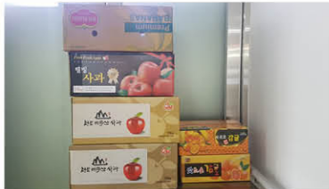
솔잎 물품, 간식 후원