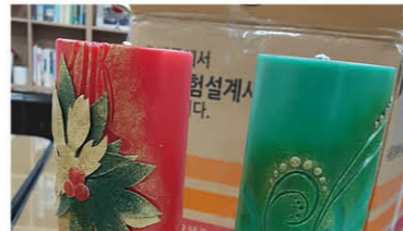
김유리 송년의 날 행사 기념품(초) 후원