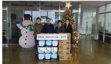
대연3동 바르게살기 운동 본부회 물품 후원