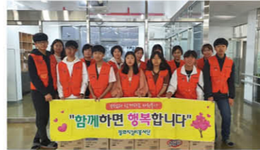
평화지킴이단 물품 후원