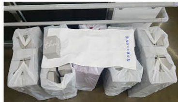
현대상사 송년의 날 기념품(수건) 후원