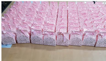
민경애, 서규환 송년의 날 기념품(립밤) 후원